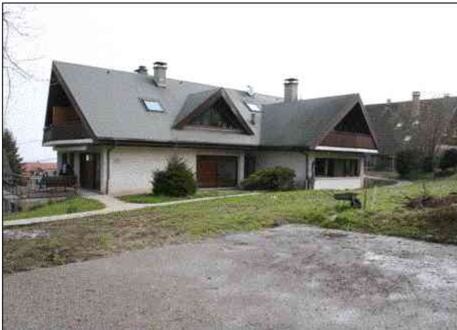
Bâtiments « ERABLE » et la « GRANGE » au fond ▼