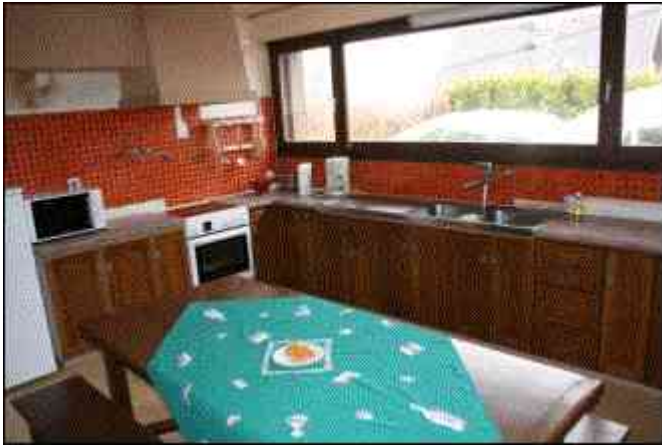
Cuisine commune (bâtiment «ERABLE») ▼