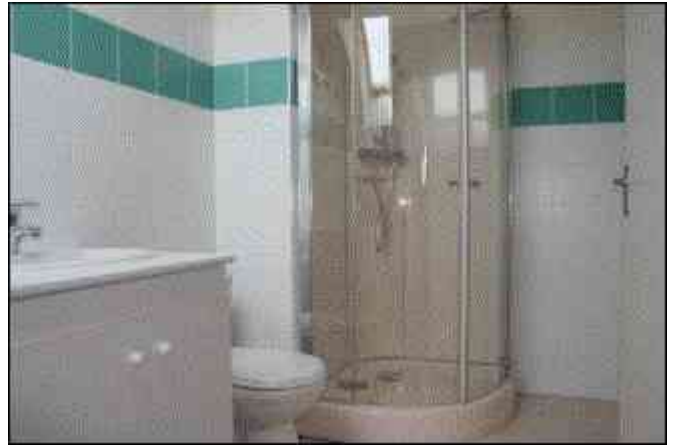
Equipements d'un appartement ( «ERABLE» ) ▼