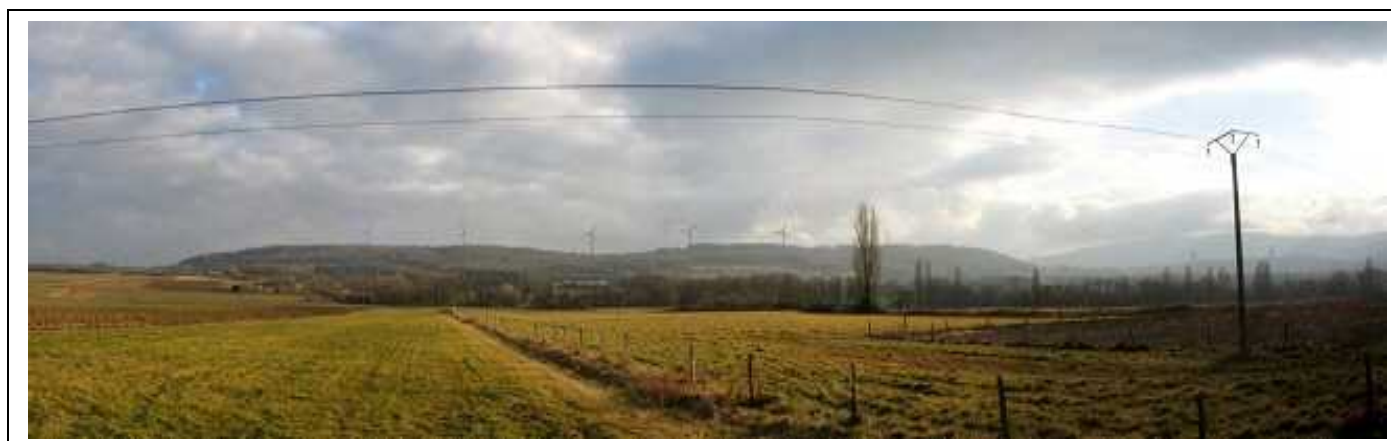
Photomontage de l'aspect visuel ( entre Viry et Chenex )