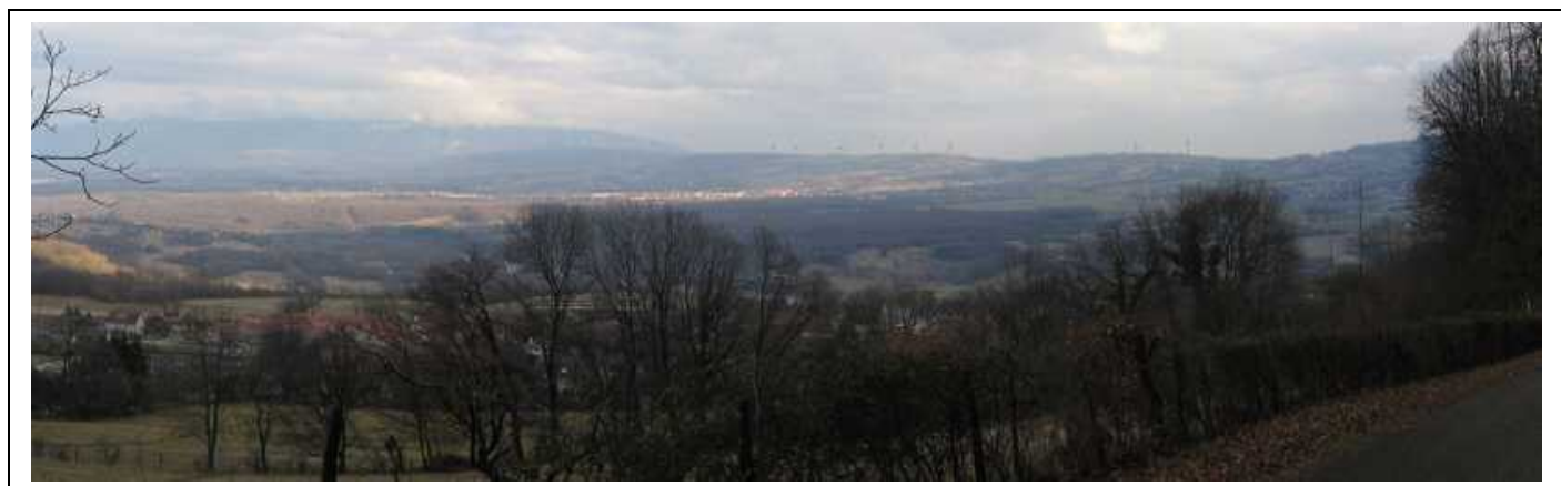
Photomontage de l'impact paysager depuis les hauteurs de Collonges-Fort l'Ecluse